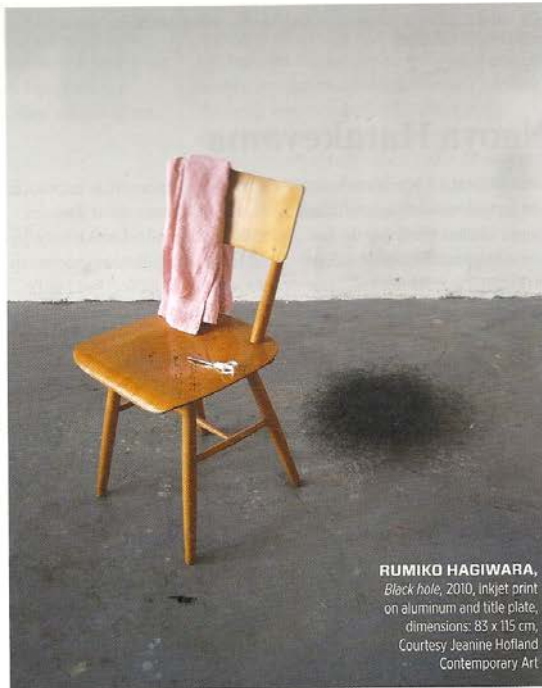
RUMIKO HAGIWARA, Black hole , 2010, inkjet print on aluminum and title plate, dimensions: 83 x 115 cm