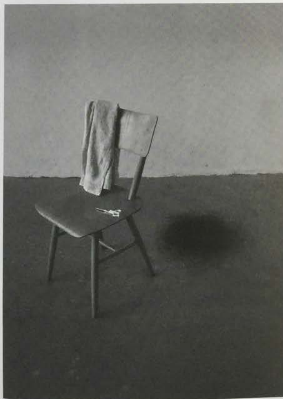
Rumiko Hagiwara, BLACK HOLE , 2010 foto: de kunstenaar