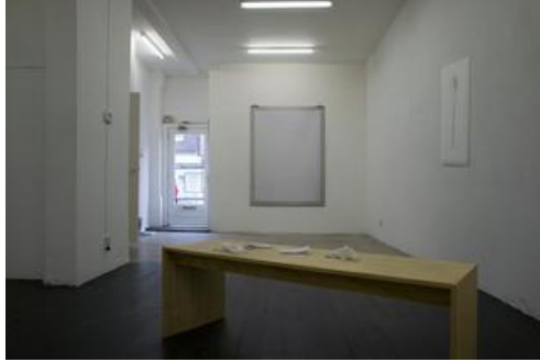
If you make that kind of joke, then we call it a lie, Jeanine Hofland Contemporary Art, 22.02.14 - 12.04.14